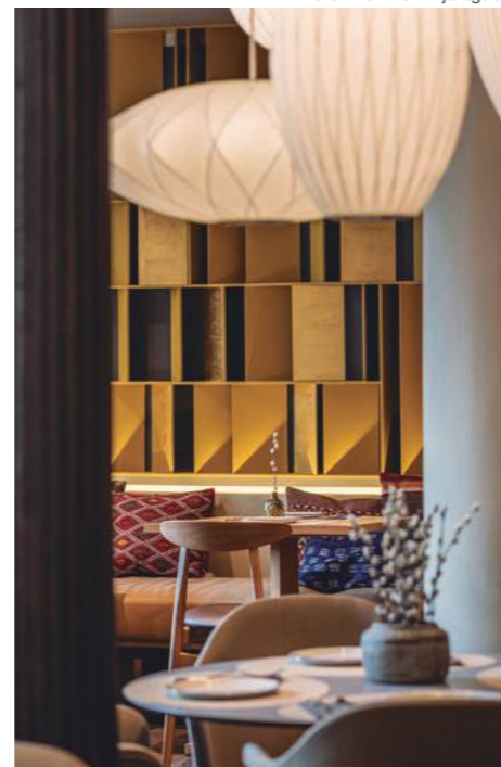
Foto: Restaurante Tagomago Salustiano, Madrid.

nuestra manera de concebir el interiorismo. Como directores creativos tomamos especial cuidado por todos los detalles. Hemos detectado que el mercado algunas veces no nos proporciona lo que estamos buscando y esto nos ha llevado al campo del diseño de producto para complementar nuestros trabajos.