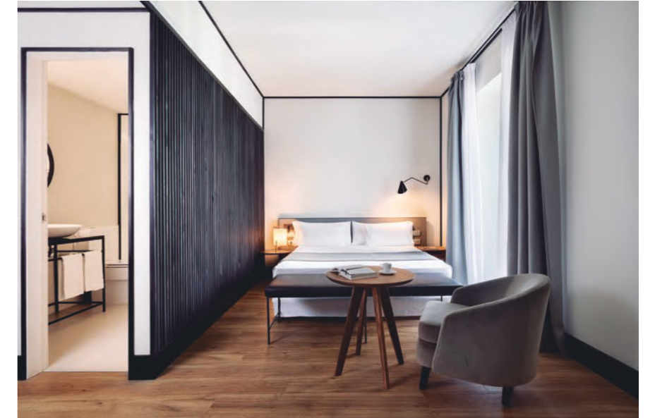
Foto: Hotel Icon Embassy by Petite Palace, Madrid.

en Girona o un Hotel H10 en Córdoba y trabajando en nuevos proyectos para dos hoteles en Lisboa. También estamos reafirmando nuestra expansión internacional con proyectos recién abiertos como el restaurante Pastamara en The Ritz Carlton en Viena o a punto de abrir otro en San Francisco o en Polonia. Este último para un conocido chef catalán con estrella Michelin. En Barcelona estamos terminando la remodelación del conocido restaurante Barceloneta y también trabajamos para jóvenes emprendedores con el proyecto de un co-working para start-ups. Además acompañamos a Grupo Saona en toda su expansión nacional y trabajamos en un restaurante chiringuito de playa en Mallorca.