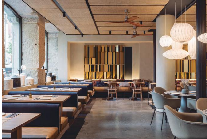
Foto: Restaurante Tagomago Salustiano, Madrid.

restaurante, donde el almacén a la vista como elemento ornamental fue un gran recurso.