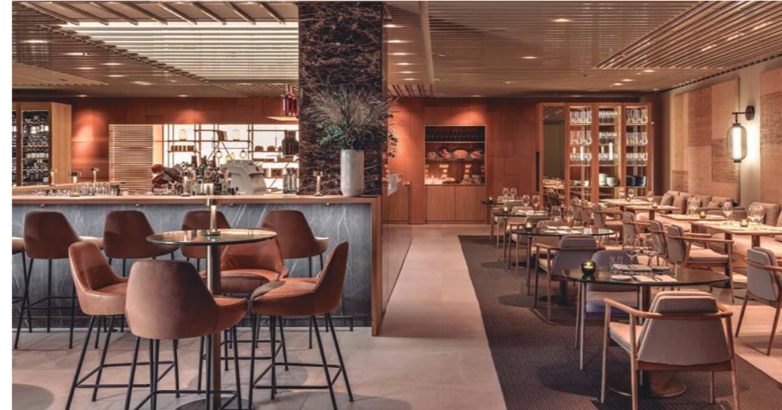
Foto: Restaurante Pastamara del Hotel Ritz-Carlton Vienna, Viena.

Entender que el concepto de hotel ha evolucionado y la experiencia del cliente (costumer journey) tiene que