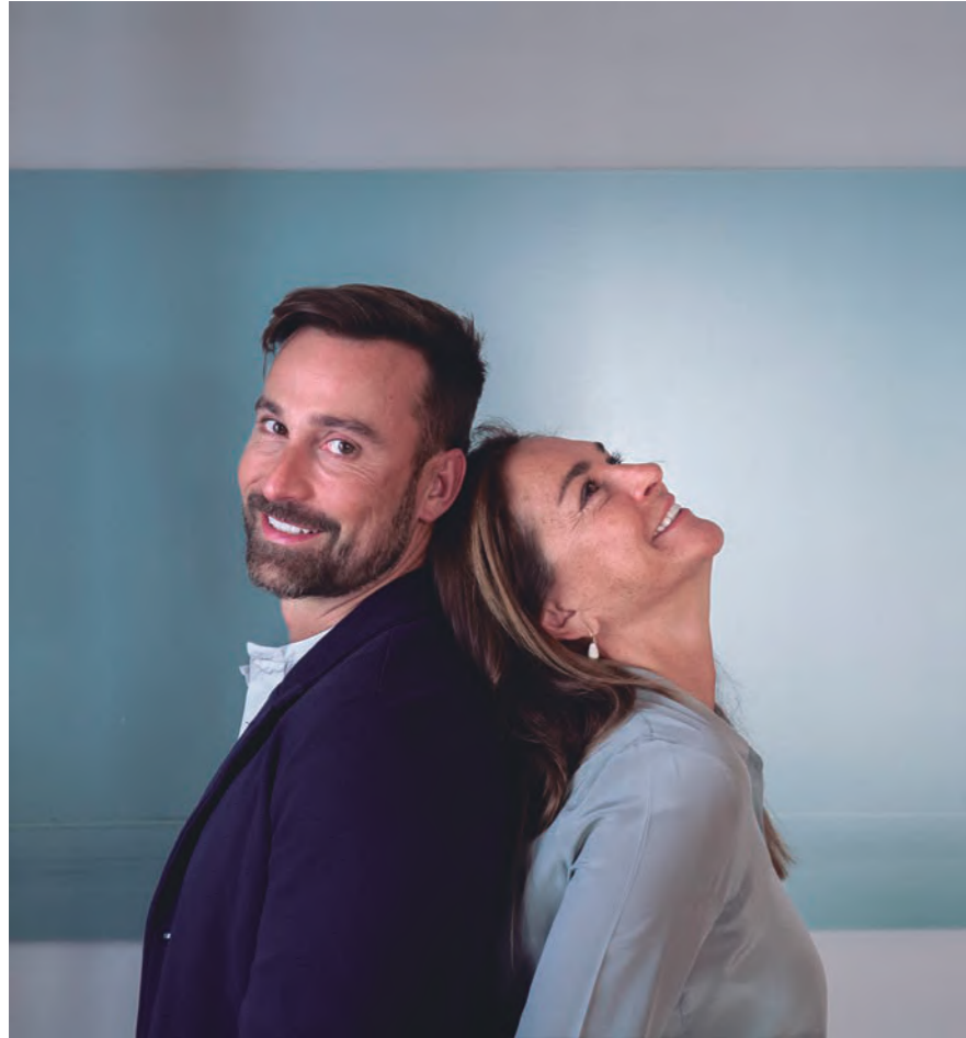
Foto: Ricard Trenchs y Sandra Tarruella (Tarruella Trenchs Studio). Foto: Ana Jiménez