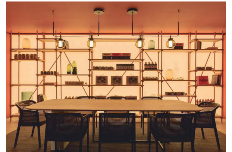
Foto: Restaurante Pastamara del Hotel Ritz-Carlton Vienna, Viena.

Uno de los elementos que definen nuestra filosofía de trabajo es que hacemos un interiorismo contemporáneo pero no de vanguardia. Digamos que hacemos un diseño atemporal, honesto y que envejece bien, por lo que seguiremos apostando por esta manera de trabajar.