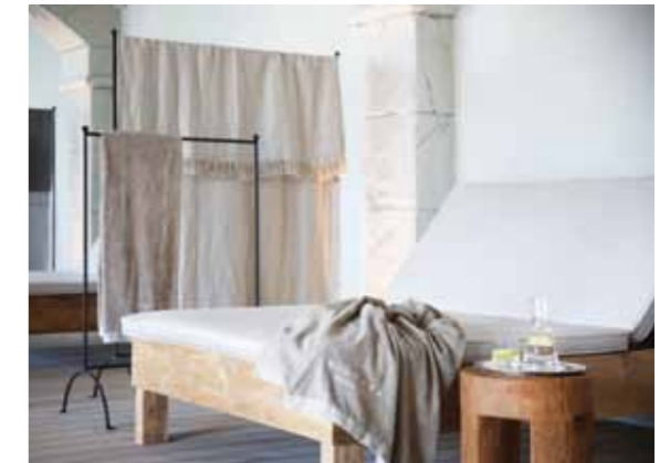
En el spa se revisten paredes, techos y pavimentos en tonos claros y se colocan colgadores metálicos con telas y toallas que funcionan como separador entre mobiliario de madera recuperada y tejidos naturales de las camas perimetrales a la piscina interior.