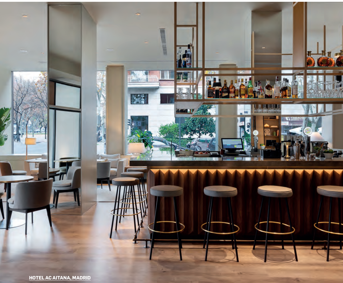
HOTEL AC AITANA, MADRID

La elección de uno u otro nos ayuda a matizar una receta para que sea más cálido o frío, más relajado o elegante, más moderno o atemporal. Preferimos los materiales nobles porque aportan honestidad al resultado, sobre todo la madera: en todas sus posibilidades siempre aporta la calidez que buscamos para nuestros espacios.