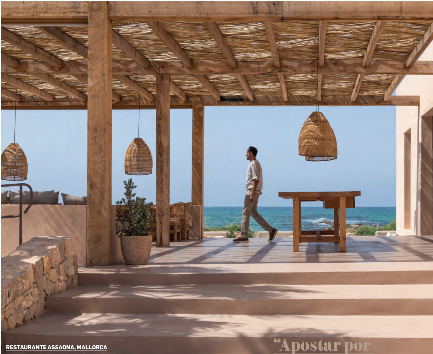
RESTAURANTE ASSAONA, MALLORCA

“Apostar por las tendencias sin analizarlas es apostar por el no diseño, el todo vale. Eso impide que el espacio se vea de manera sólida”