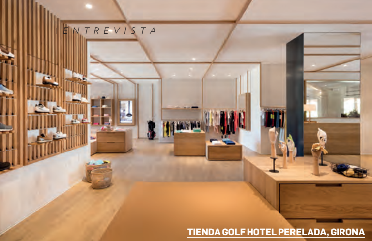
TIENDA GOLF HOTEL PERELADA, GIRONA