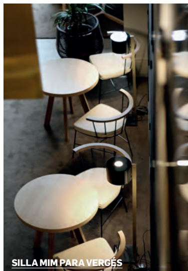
SILLA MIM PARA VERGÉS