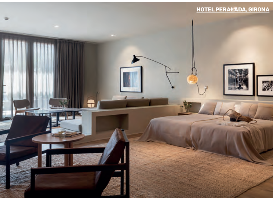
HOTEL PERALADA, GIRONA

“Apostar por las tendencias sin analizarlas es apostar por el no diseño, el todo vale. Eso impide que el espacio se vea de manera sólida”